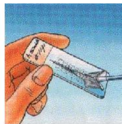
Рис. 4 Содержимое цервикс- щеточки наносят на предметное стекло

Очень важно правильно ввести конус щеточки в цервикальный канал, т.к. от этой манипуляции зависит качество взятия соскоба. Далее щеточка удаляется из влагалища, ее содержимое наносится на предметное стекло линейным движением вдоль стекла, используя обе стороны щеточки (рис. 4). При окраске по Папаниколау мазок фиксируется, при других окрасках фиксация не требуется (мазки высушиваются на воздухе).