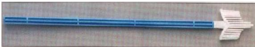
Рис. 1 Цервикс-щеточка ("cervix-brush")

У женщин с визуально нормальной шейкой матки мазки берутся методом поверхностного соскоба, производимого одноразовой цервикс-щеточкой типа «cervix brush» (рис.1) или «cyto brush».